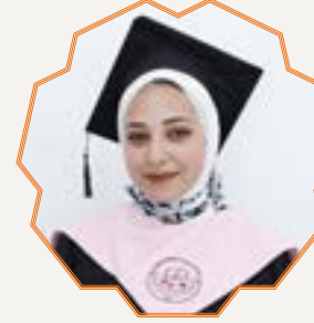
ملاك رائد مصطفى شن