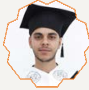
أمير علي يوسف اشتيه